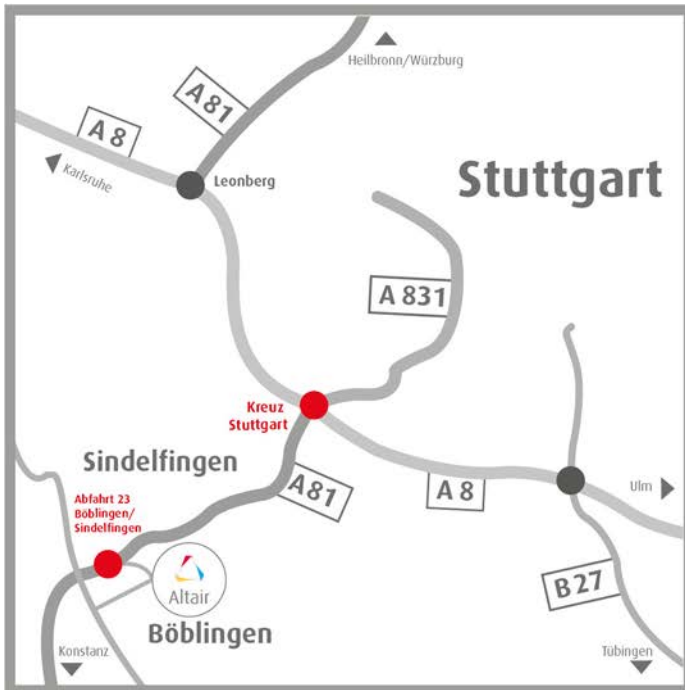
Abb. 1 Übersichtskarte

Calwer Straße 7 • 71034 Böblingen • Tel.: +49.7031.6208.0